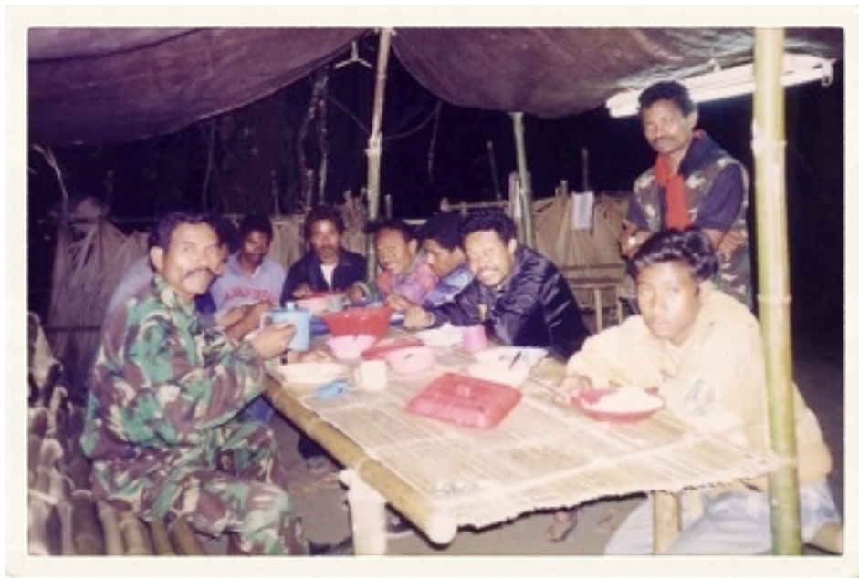
Makan Malam di Markas Falintil, Uai Mori, Viqueque, Agustus 1999.

“Jadi, kami sesama warga Timtim sebenarnya tidak pernah terlibat kerusuhan. Kami saling melindungi. Karena itu kalau ada seorang pengikut pro-otonomi tertembak, saya berani menjamin itu bukan dari peluru kami, begitu juga sebaliknya,” kata Matan Ruak ringan sambil tertawa. “Kami hanya ‘berperang’ melawan militer,” lanjutnya.