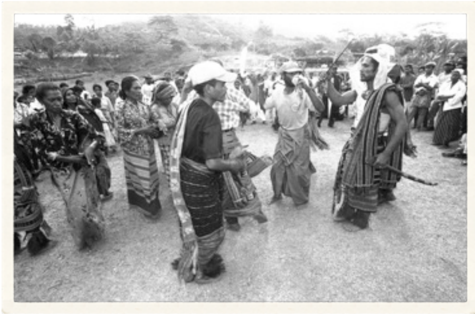
Menari dan bernyanyi menyambut hari referendum.

"Proses pemungutan di Timor Timur sudah selesai. Seluruh pos pemilihan yang dibuka pukul 08.00, sudah ditutup dan yang terakhir ditutup adalah di Casa, yang baru ditutup pukul 18.30," kata Jeff Fischer, Ketua Komisi Pemilihan. Menurut Fischer, penghitungan suara memerlukan waktu sekitar satu minggu.