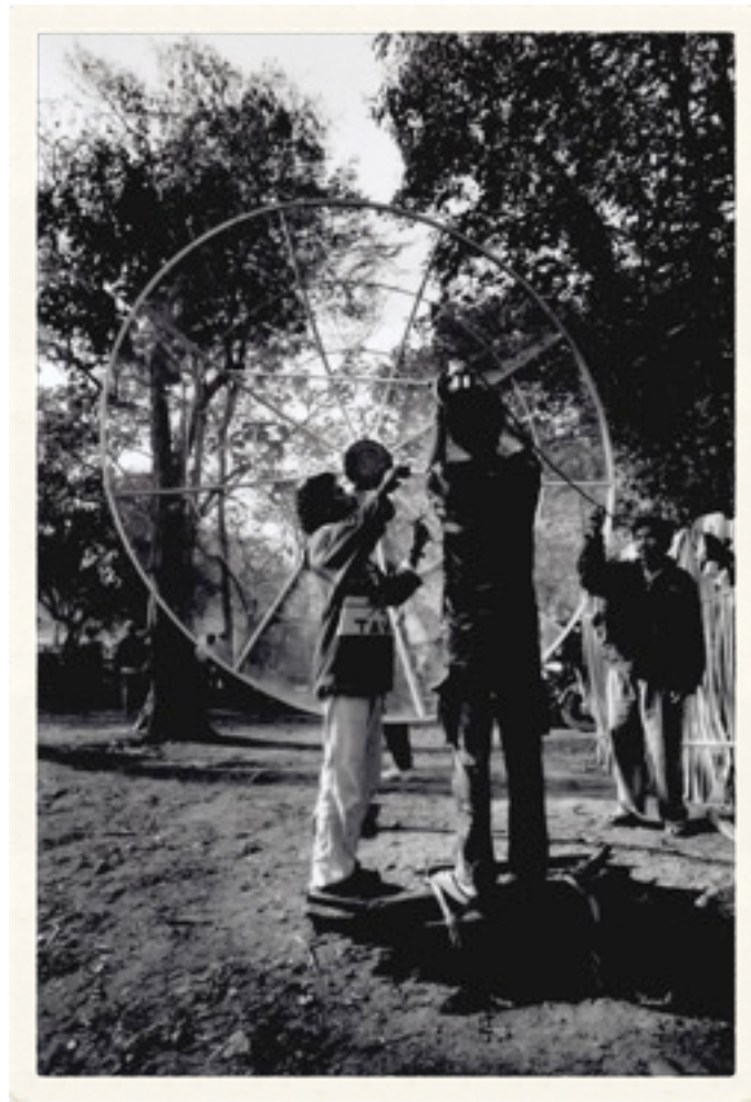
Memasang parabola di markas Falintil

Jepang. Tak hanya itu, mereka pun dilengkapi dengan mobile radio station yang menggunakan jalur FM.