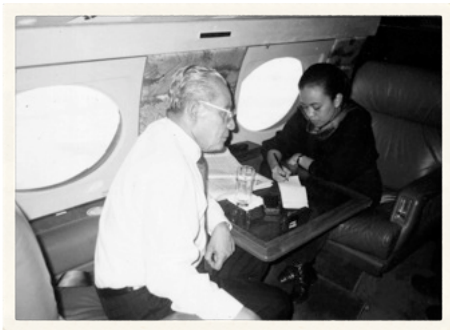
Menteri Luar Negeri Ali Alatas berbincang dengan penulis dalam perjalanan khusus dari Phnom Penh ke Jakarta, usai memimpin perundingan perdamaian Kamboja, tahun 1997