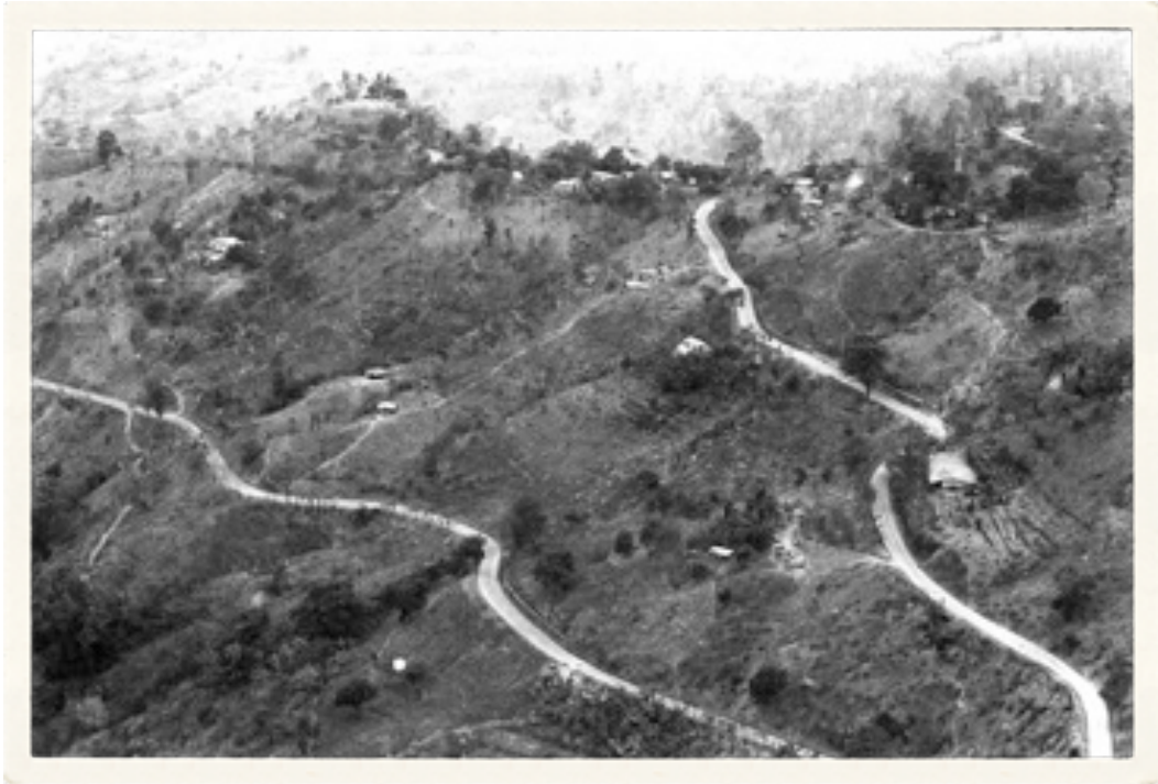
Markas resmi Falintil di Remixio, Aileu.

“Pastilah Pak, menurut pengalaman saya selama ini, omongan Matan Ruak selalu bisa dipegang,” jawab saya yakin.