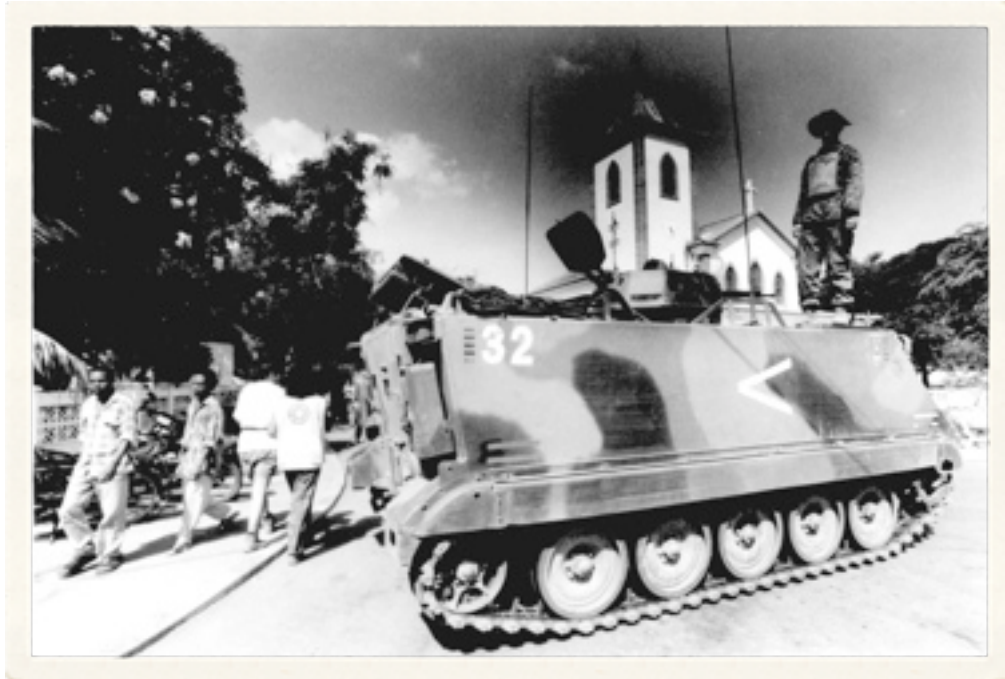
Barikade di depan Gereja Motael, Pantai Faroul, Dili, 29 Oktober 1999

Di kesempatan ini pula tanpa diduga, saya mendapat cerita yang berbau setengah pengakuan “dosa” dari seorang teman. Hari itu, ia mengatakan ingin berbicara dari hati ke hati. Tanpa curiga sedikit pun, dengan senang hati saya mengiyakan. Kami pun menuju ruang depan Makorem yang tidak terlalu padat.