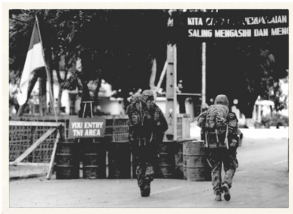
Memasuki kekuasaan TNI, Pantai Faroul, Dili, 29 Oktober 1999

Leandro semakin kaget. Ia lalu mengontak Pak Suryo melalui inmarsat. Jelas ia amat sangat kecewa dengan kondisi tersebut. Terutama birokrasi yang berlebihan dari INTERFET. Ia juga kecewa karena tidak bisa menemui Pak Suryo secara pribadi. Saya tidak tahu mengapa birokrasi menjadi sangat rumit jika menyangkut segala hal yang “berbau” Indonesia? Sungguh saya tidak tahu.