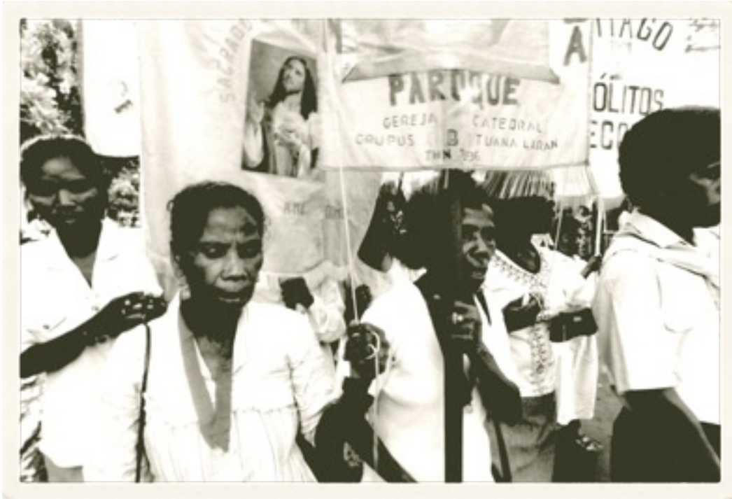
Bersiap-siap mengikuti Misa Kudus Devosi kepada Bunda Maria.

Namun, seluruhnya berubah justru ketika saya mengikuti dengan cermat homili Uskup pada Misa Penutupan bulan Oktober, atau bulan devosi kepada Bunda Maria itu. Uskup menyampaikan khotbah dalam empat bahasa, yaitu Tetun, Portugis, Indonesia, dan Inggris. Sayang dari empat bahasa itu, hanya dua yang saya pahami yaitu Indonesia dan Inggris.