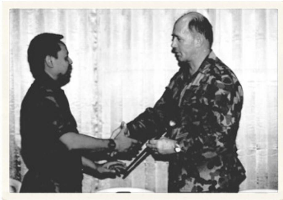
Mayjen TNI Kiki Syahnakri, Panglima Darurat Militer menyerahkan tongkat Komando Pengendalian (Kodal) kepada Mayjen Peter Cosgrove, Komandan INTERFET di Dili, Senin 27 September 1999.

Semula, acara itu direncanakan diadakan secara terbuka di Bandara Komoro, Dili. Karena itu, pihak Indonesia pun mendatangkan sekitar 30 wartawan dari Jakarta untuk meliput acara bersejarah bagi Indonesia ini. Seluruh wartawan berangkat dari Mabes Cilangkap, dengan pengawalan khusus dari Kol. Panggih.