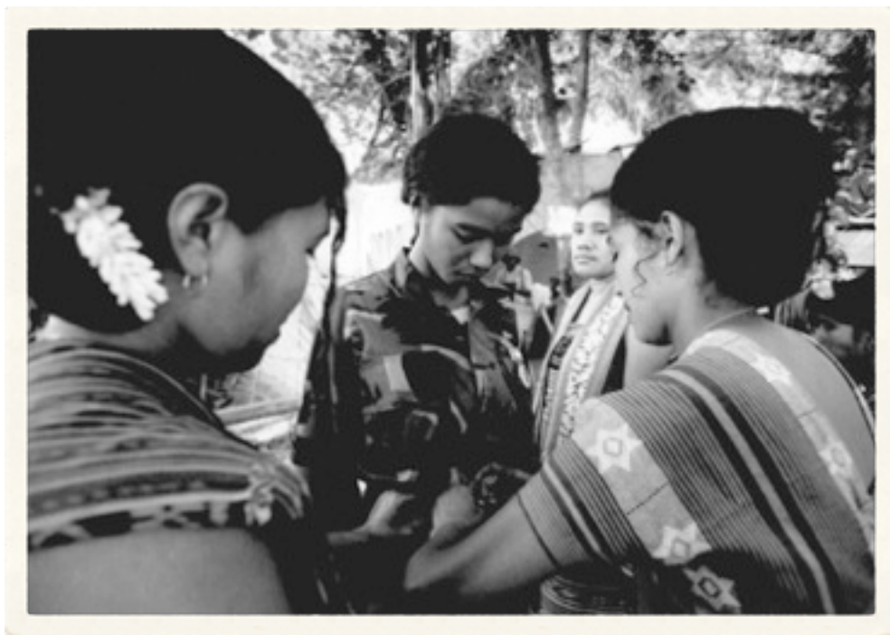
Bersiap-siap mengikuti perayaan HUT Falintil ke-24.

Mereka datang secara perorangan, atau dalam bentuk rombongan, menggunakan truk sewaan. "Saya ke sini menyewa mikrolet Rp 120.000, tapi mereka itu ada yang menyewa truk sampai satu juta rupiah," kata Maria yang mengaku sudah berada di Region III, Uai Mori, beberapa hari sebelumnya. Ia bersama suaminya, seorang pegawai Pemda Baucau, sengaja berada di tempat itu untuk mempersiapkan acara yang baru pertama kali setelah 24 tahun tersebut.