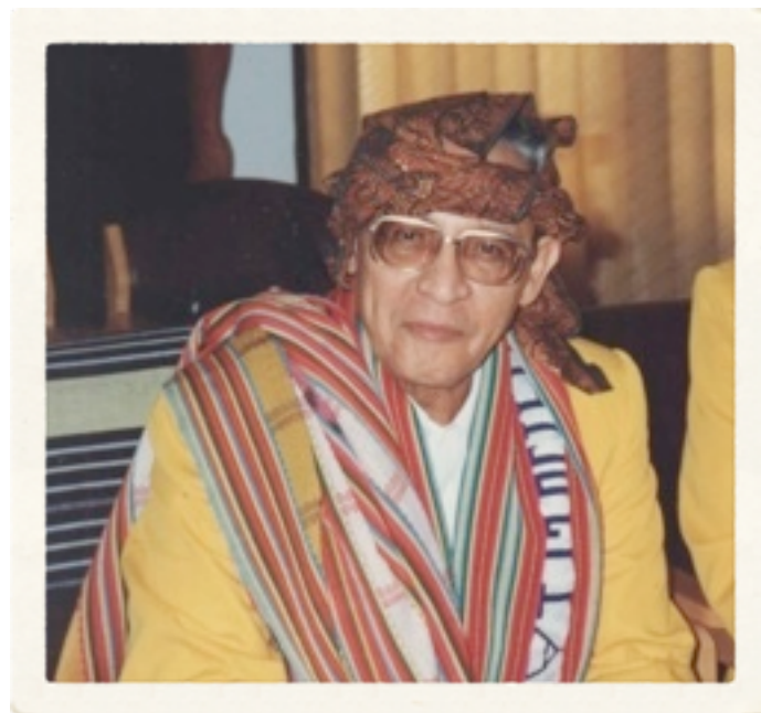
Menu Ali Alatas dalam busana tradisional Timtim ketika berkunjung ke Dili

Tanpa terasa dan tanpa pernah terduga, ucapan itu menjadi kalimat terakhirnya. Dan pengantar yang ditulis Pak Alatas pun menjadi karya tulis terakhir yang diberikan kepada saya. Rasa haru, duka dan kehilangan yang mendalam terukir dalam tiap butir air mata yang terus mengalir. Namun, semua itu takkan pernah mengurangi rasa hormat, cinta kasih, dan penghargaan kami yang begitu tinggi. Selamat jalan Pak Ali...***