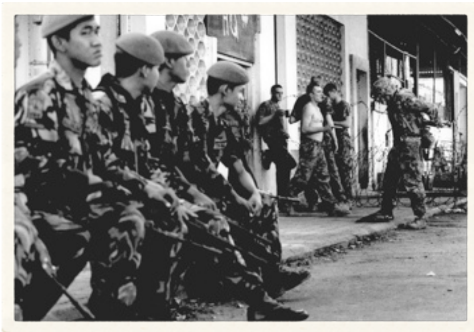
Pasukan TNI "menonton" tentara INTERFET yang sedang bercanda di depan markasnya.

Segi positif dari kondisi TNI adalah, entah bagaimana caranya, prajurit TNI terlihat lebih segar, sehat, langsing tetapi berotot, tidak berlemak, dan lebih gesit. Penampilan mereka setara dengan pasukan Gurkha (Inggris) atau serdadu Amerika Serikat yang jelas tampilan fisiknya begitu terjaga. Tentu penampilan ini jauh berbeda dengan tentara Australia yang rata-rata tebal dan gembur, sehingga seperti sulit bergerak.