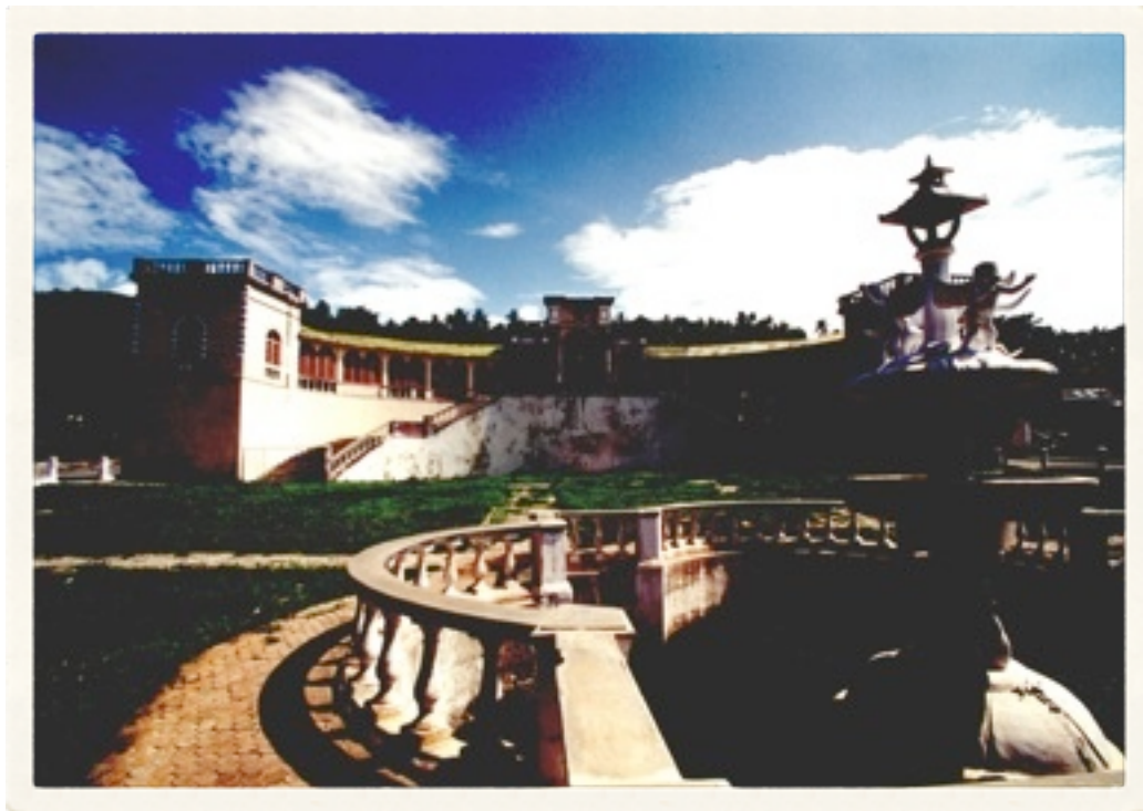
Pusat Kota Baucau.