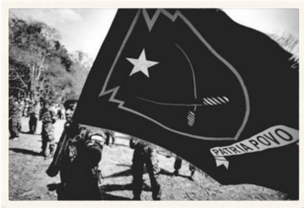
Bendera Falintil, "Patria Povo Orda".

Kali ini mereka memang membuat pesta besar. Di tengah lapangan seluas lima hektar itu didirikan panggung terbuka. Semalam suntuk mereka bernyanyi dan berdansa di arena itu, diiringi para penyanyi Gabungan Artis Timor, yang juga sering tampil di kelompok pro-otonomi. Penyanyi ini pula yang mempopulerkan lagu Oras To' O Ona Mak Ita Hili (Tiba saatnya kita memilih), lagu pemilu di Timtim. Di tengah hutan itu, lagu pemilihan itu pun didengarkan.