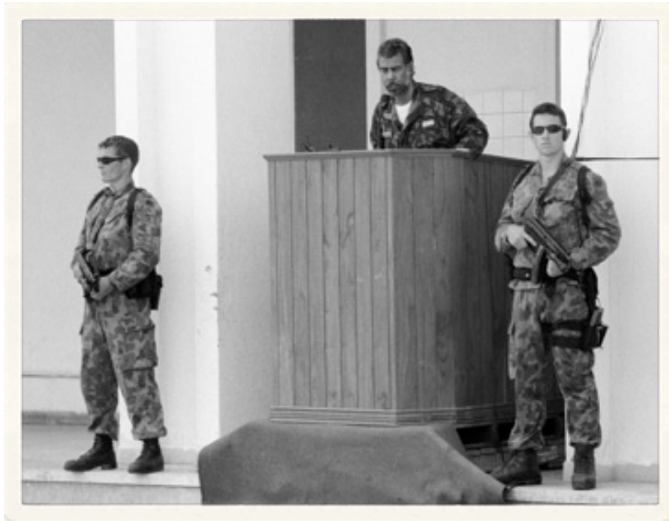
Pidato pertama Kay Rala Xanana Gusmão