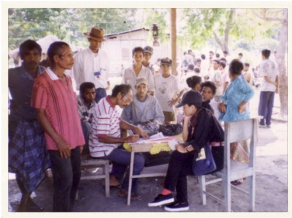
Mendata peserta jajak pendapat di wilayah Betano.

Mengutip penjelasan Luis Bittencourt, Ketua UNAMET setempat, banyak warga Ambeno yang belum terdaftar, karena wilayah itu harus menampung pendatang sekitar 6.000 hingga 7.000 orang dari Timor barat yang tersebar di Desa Baokanana, Bobometo, dan Oekusi. Sementara, Ambeno sendiri mempunyai 30.776 warga yang mempunyai hak pilih.