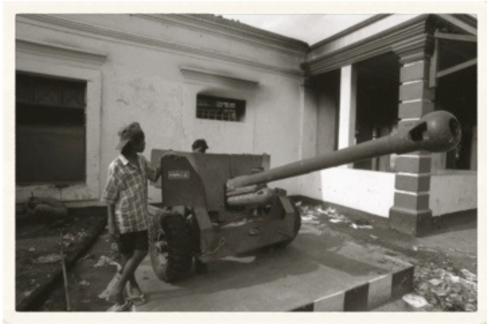
Dua anak bermain di depan bangunan yang hangus terbakar di kota Dili

Dili telah menjadi kota mati. Hampir seluruh bangunan terlalap api. Hangus. Sebagian rata dengan tanah. Kota yang pernah semarak itu kini tinggal menyisakan abu dan puing-puing yang hitam mengering, bekas terbakar.